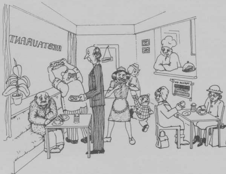
« Vous avez une carte d'identité ? »